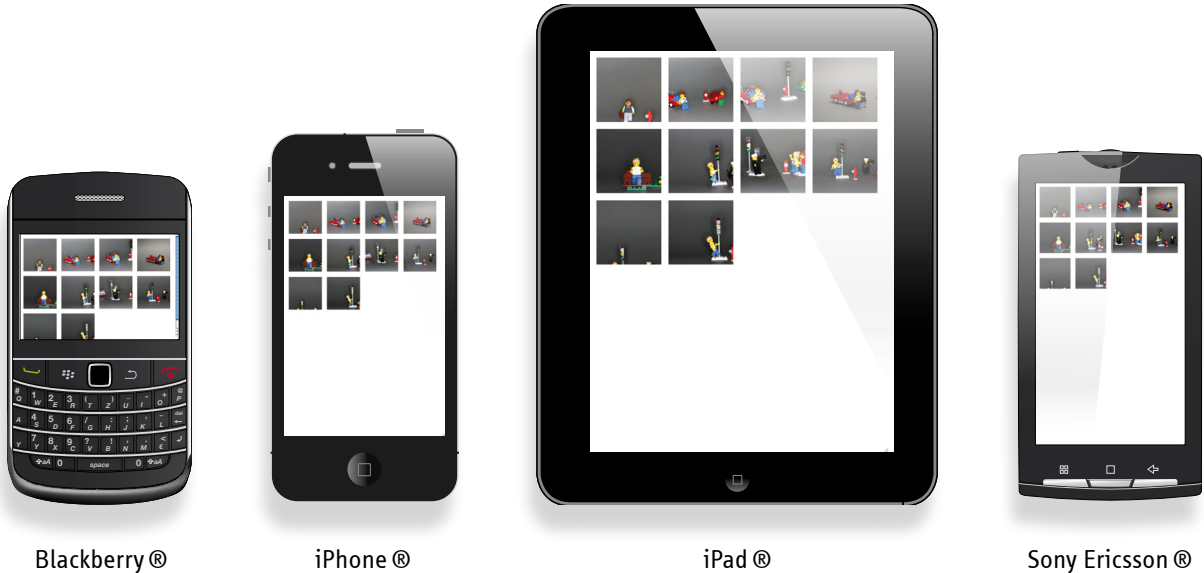
Beispielhafte Darstellung einer Webgalerie auf verschiedenen Ausgabegeräten

Intermedia Fotoficient ist ein Web Image Publishing Framework, das Publikationsprozesse von Bildern ins Web revolutioniert!